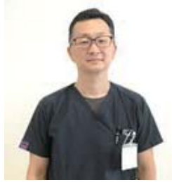
日本精神神経学会 専門医 日本医師会認定 産業医