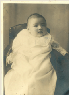
① 生後100日頃でしょうか。既に整った顔をされていますね!!!

今回、新たな企画として、清和病院の職員の若かりし頃の写真を掲載し、写真が誰であるかを当てていただきたいと思っております。「正解者にはもちろん豪華景品が!!!」と言いたいところですが、次号に正解を掲載させていただきますので、その時までのドキドキをプレゼントさせていただきます。それでは、記念すべき第1回目の方はこちらです(*^^*)