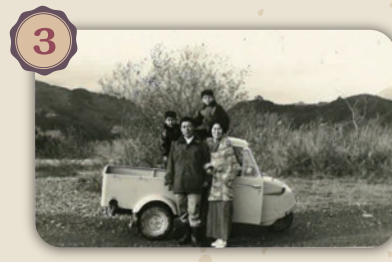
素敵な家族写真ですね! 右上の少年、小学生頃でしょうか。お父様お母様から正解にたどり着けるかも!?