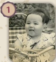
0歳頃の写真です。ぶくぶくのほっぺがたまりませんね。

皆様、前号の「昭和にタイムスリップ」第2弾の方、予想できましたか? 正解は、駄場中研院長先生でした!!! 面影がありましたよね? 是非見返してみてください。では、昭和にタイムスリップ第3弾です。今回も、年代物の写真をお借りしてきました。皆様、沢山のご回答をお待ちしております。