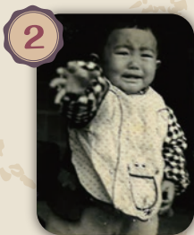
1歳3ヶ月頃の写真です。「もっとうちようだい!!!」の表情でしょうか(^^)